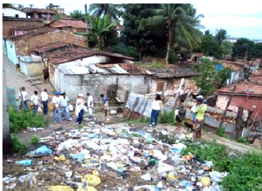
Imagem 07: Um dos terrenos públicos utilizados como depósito de lixo

Um grande problema encontrado, no bairro, é a questão da saúde pública. Um levantamento feito pela Fapesq (Fundação de Apoio à Pesquisa do Estado da Paraíba), no local, confirmou o Pedregal como uma situação de calamidade pública: vários focos de mosquito, terrenos baldios usados como lixão e ruas com esgoto a céu aberto. Os moradores solicitaram que fossem colocados depósitos de lixo, nas ruas, que não são beneficiadas com a passagem do carro de lixo.